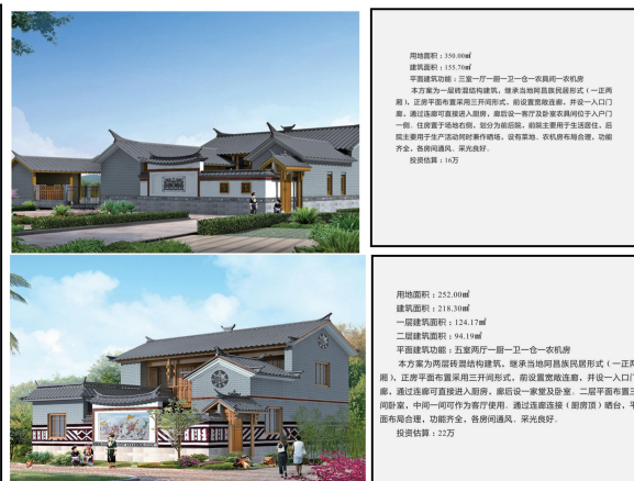
新建自建房通用图