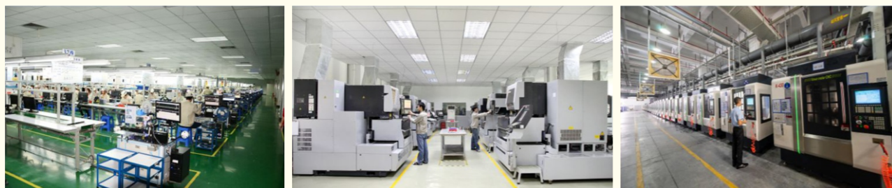
干净整洁的车间环境