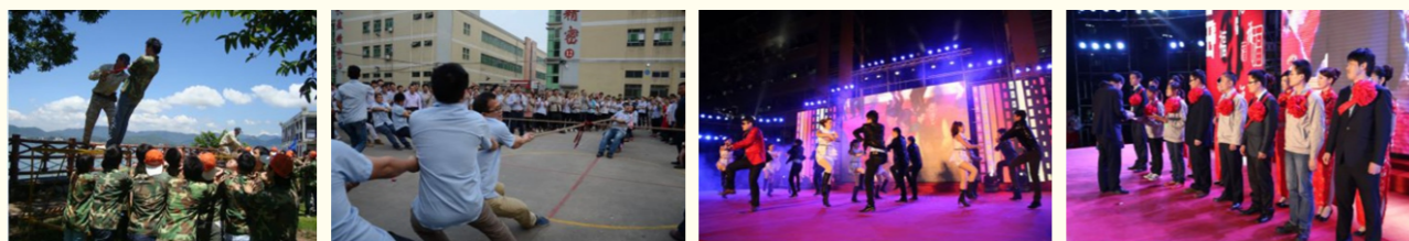
丰富多彩的员工活动