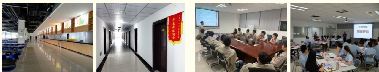
卫生健康的自营食堂与宽敞明亮的员工宿舍